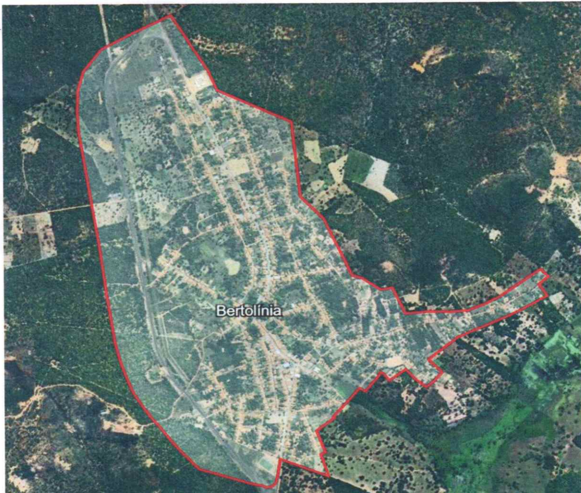
Figura: Delimitação do perímetro urbano do município de Bertolândia - PI.

O perímetro acima descrito define a área urbana do município de Bertolândia – PI, sendo utilizado como referência oficial para fins de planejamento territorial, expansão urbana, tributação e regularização fundiária.